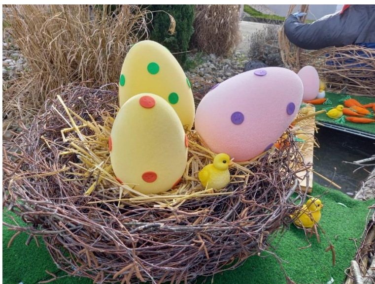
Nid, ci-dessous, réalisé par Jeanine Gaillet