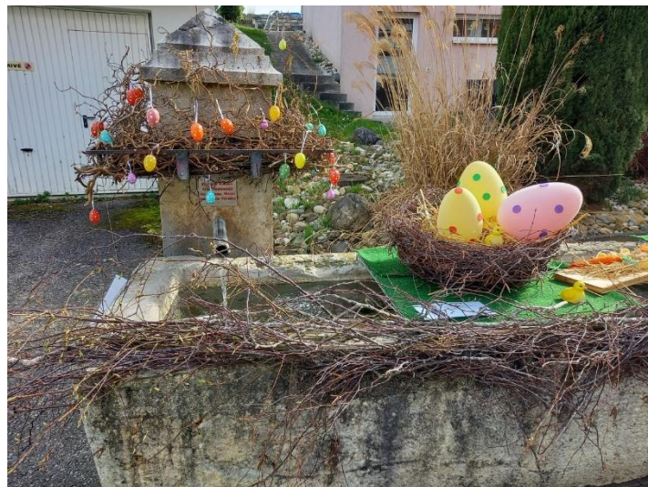
La fontaine de Joressens décorée !